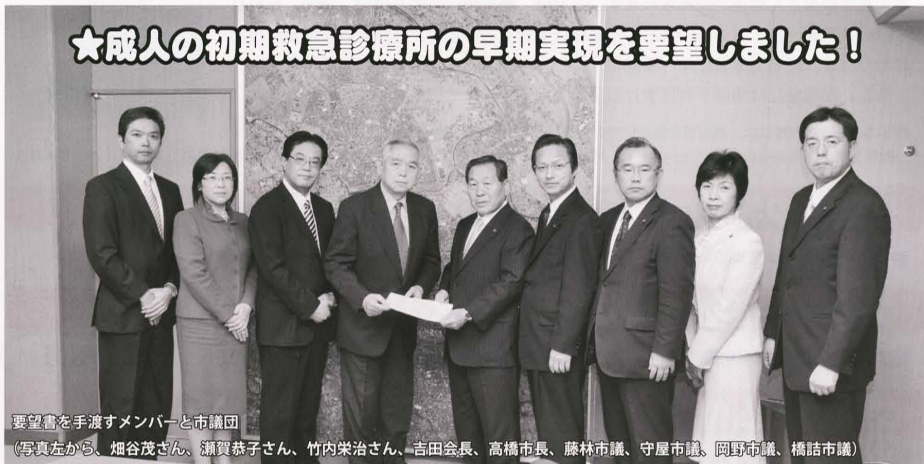
要望書を手渡すメンバーと市議団